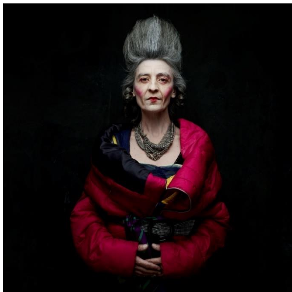
Ground Zero